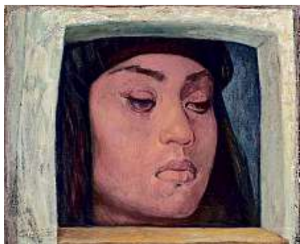
Este cuadro, "Cara de mujer", es de Jorge González Camarena y es parte de la exposición "Casa Abierta".