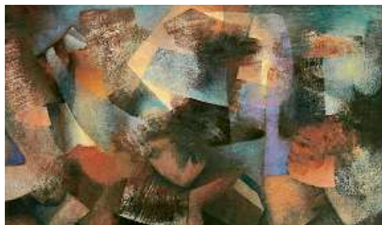
Obra de Irma Serna, de 1981, sin título y parte del acervo del Museo Cabañas.

to Gómez Barbosa, que retrata una de las salas del museo: son algunas de las obras que realmente han sido poco vistas.